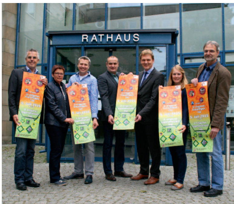
Freuen sich auf den Freiwilligentag und den Jugendfreizeittag am 5. Juli: die Organisatoren vom Freiwilligenzentrum und der Stadt Lingen.